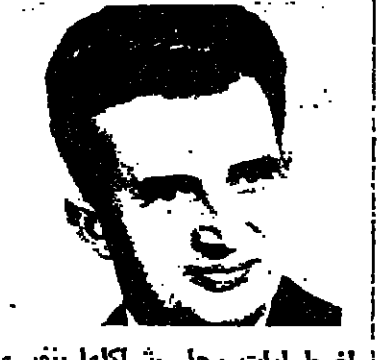
البنية على 3 ع 8

القاهرة - صرح السيد كمال حسن على وزير الخارجية المصري بان بلاده تنهج بيق بالتحول العسكري الليبي في تشاد واحتلال القوات الليبية لاجزاء من الاراضي الليبية